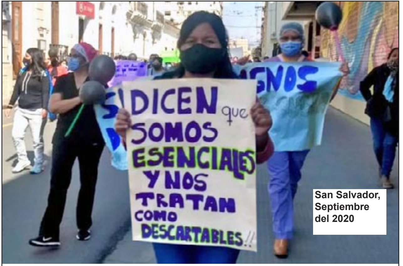
San Salvador, Septiembre del 2020

La derecha electoral no salvará de este descalabro sanitario y económico del actual gobierno de Nayib Bukele, la deuda de El Salvador de casi el 93% del PIB es una deuda que pagarán todos los trabajadores del país y las futuras generaciones todo ello en beneficio de un pequeño grupo de burgueses. Este intercambio de palabras nos llama a la reflexión de una urgente alternativa revolucionaria para la