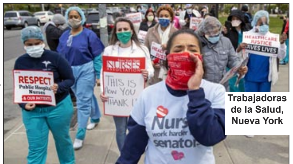
Trabajadoras de la Salud, Nueva York