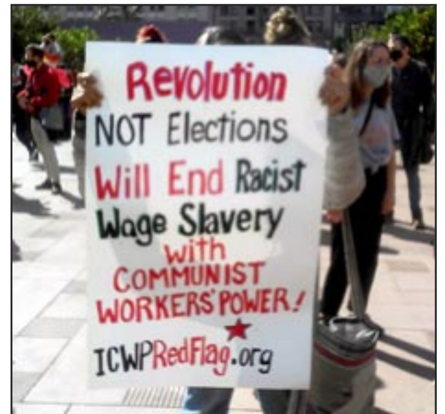
Los Angeles, EE.UU. 7 de Noviembre “La Revolución, No las elecciones Terminará con la Racista Esclavitud Salarial con el poder Obrero Comunista”

Cuando y adonde el Partido logre movilizar a las masas para establecer el poder obrero comu-