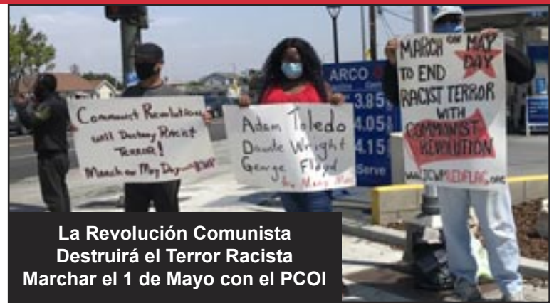
La Revolución Comunista Destruirá el Terror Racista Marchar el 1 de Mayo con el PCOI

El comunismo prospera con la unidad de las