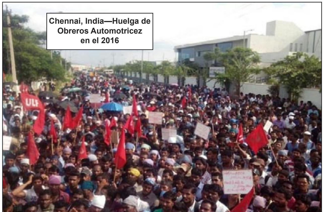
Chennai, India—Huelga de Obreros Automotrices en el 2016

Otro trabajador mencionó a un pariente que trabaja en la industria automotriz en Colombo, Sri Lanka. Le gustaría enviarle copias de Bandera Roja . Nuestro encuentro terminó con la moral muy en alto. Los camaradas están entusiasmados de que ahora sea posible un Partido Comunista Obrero Internacional masivo. Tenemos que superar nuestras contradicciones internas de manera camaraderil y alentadora con la ayuda de nuestro Partido internacional.