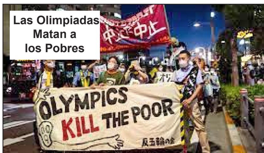
Las Olimpiadas Matan a los Pobres