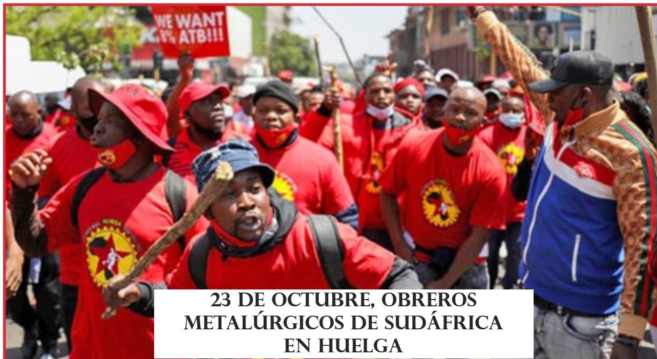
23 DE OCTUBRE, OBREROS METALÚRGICOS DE SUDÁFRICA EN HUELGA