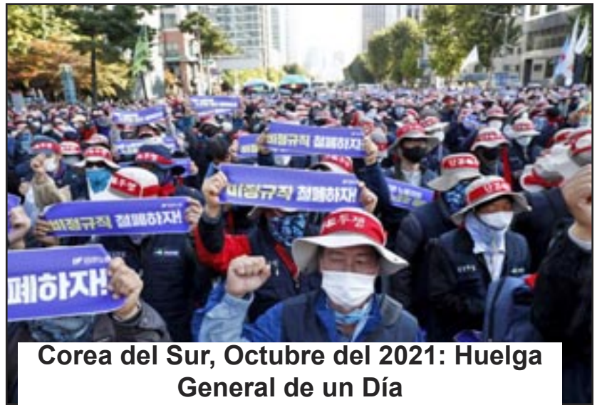
Corea del Sur, Octubre del 2021: Huelga General de un Día

¡La creciente ola de huelgas internacionales abre nuevas oportunidades para que el Partido crezca ahora!