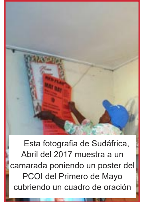
Esta fotografía de Sudáfrica, Abril del 2017 muestra a un camarada poniendo un poster del PCOI del Primero de Mayo cubriendo un cuadro de oración

El PCOI debe refutar esta ideología destructiva porque detiene a la clase trabajadora. Necesitamos, como comunistas, crear el cielo en la tierra, durante nuestras vidas, poniendo fin a la explotación, el racismo, el sexismo y la pobreza durante nuestra vida. Debemos luchar contra la creencia cristiana de que está bien que los trabajadores sufran en esta vida porque en la “próxima” no habrá sufrimiento alguno.