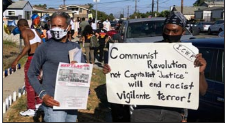
¡Revolución Comunista, No “Justicia” Capitalista Acabará el Terror Racista de Vigilantes!

El potencial de reclutamiento comunista está creciendo ahora. Nuevos miembros del PCOI son cruciales para desarrollar las ideas y la energía