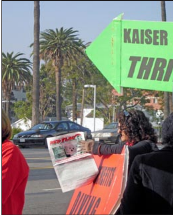
Los Ángeles (EE.UU.) 2012 Enfermera huelguista con Bandera Roja en línea de piquete en Kaiser

Los miembros del Partido han enfatizado en reuniones recientes que la reforma y la revolución comunista son contradictorias. Algunos amigos ven la reforma como inútil. Al mismo tiempo, muchos participan en la lucha reformista porque piensan que no hay otra alternativa.