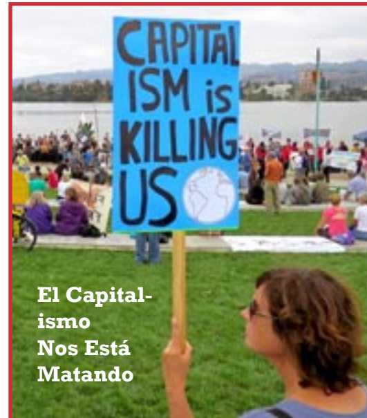
El Capitalismo Nos Está Matando