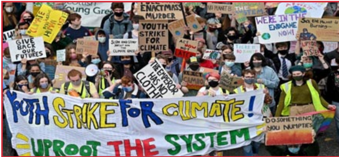
¡Jóvenes en Huelga por el Clima! ¡Desarraigar el Sistema!