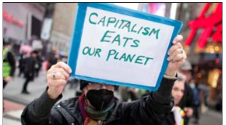
Glasgow, noviembre 2021: Masas protestaron contra la inservible Conferencia de la ONU sobre el Cambio Climático del imperialismo. (El cartel dice "El capitalismo se come nuestro planeta")

Lo tenemos que hacer colectivamente. No podemos hacerlo individualmente. Tenemos que luchar contra la enfermedad, que es el capitalismo. Haciendo esto, podremos luchar contra el cambio climático.