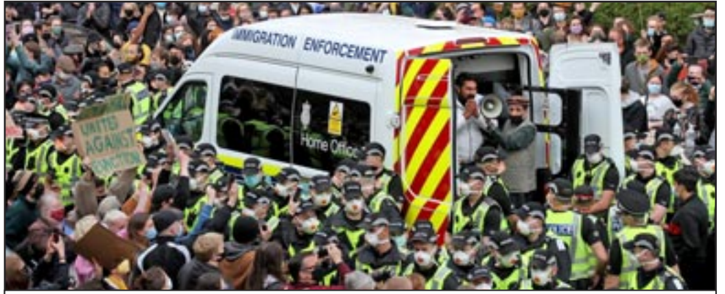
Glasgow, Scotland, mayo 2021 - Cientos evitan que agentes de inmigración arresten a dos migrantes

Gran Bretaña solo acepta el 1% de los refugiados que se dirigen a Europa. Quienes eligen Gran Bretaña lo hacen principalmente por conexiones familiares o porque hablan inglés. Los medios de