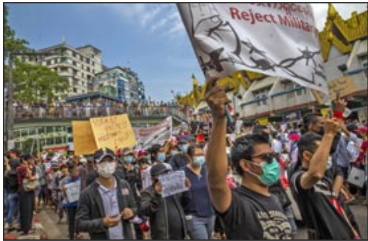
YANGON (Myanmar) - Miles de personas desafían a la policía militar y luchan por ponerle fin a la dictadura militar instalada por el golpe de estado de febrero de 2021.

El golpe del 6 de enero fracasó, pero los seguidores de Trump aún cosechan los frutos de décadas de apoyo de las fundaciones Bradley y Heritage (y fuentes ocultas). Controlan la mayor parte del Partido Republicano. Continúan movilizándose en las trastiendas políticas y en las calles.