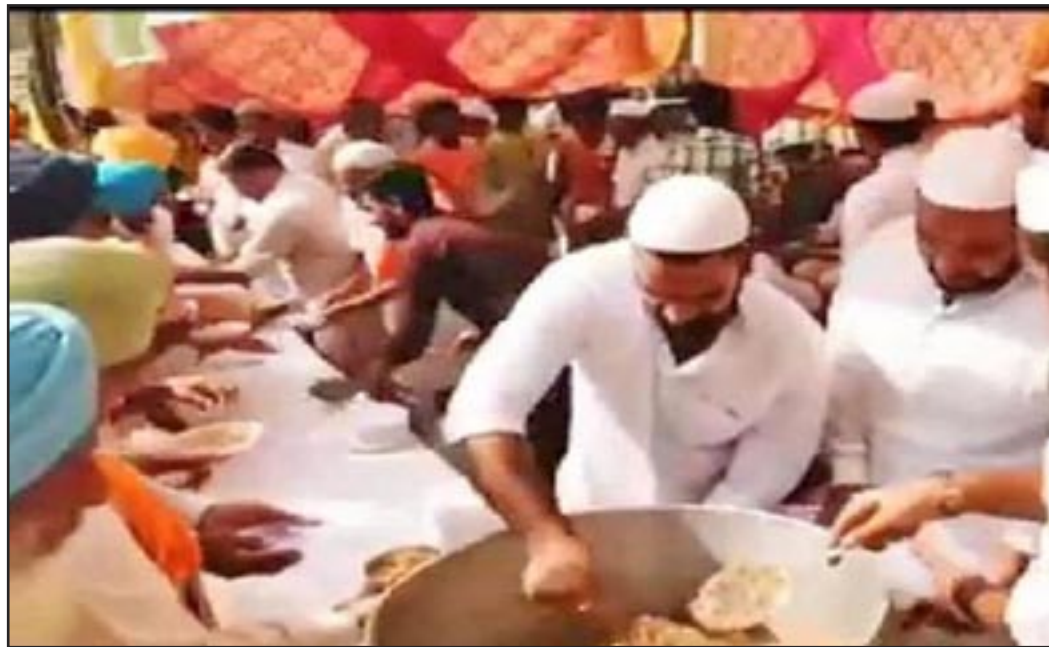
Musulmanes preparan comida para agricultores Sikh

Ella y camaradas como ella están liderando al PCOI y a las masas ahora, y más lo harán en el futuro. El fascismo de Modi está creando las condiciones para que amplíemos la base del comunismo en la India y en todo el mundo. Nuestra nueva camarada y su colectivo están preparando un mensaje de solidaridad para nuestros camaradas en El Salvador. Su mensaje resonará en todo el mundo, señalando el potencial comunista y un futuro brillante.