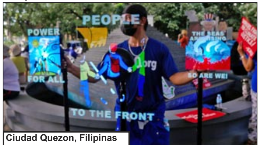
Ciudad Quezon, Filipinas

El comunismo nos permitirá tomar el control colectivo de nuestros lugares de trabajo y nuestro mundo. Si nos unimos al Partido Comunista Obrero Internacional, todos podemos ayudar a lograrlo - antes de que sea demasiado tarde.