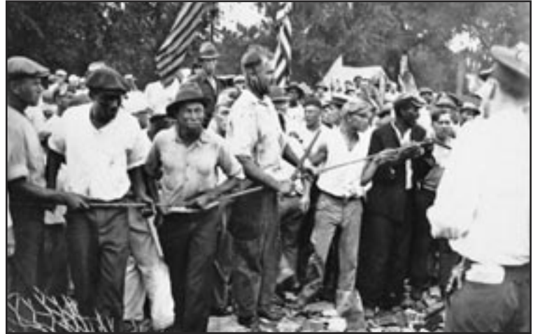
1932—Veteranos negros y blancos de la 1 Guerra Mundial marchan en Washington demandando compensación por su servicio militar. Atacados por el ejército de EEUU se defienden militantemente.

La revolución comunista destruirá el sistema salarial. Trabajaremos juntos por nuestras necesidades colectivas. Anclado entre los miles de millones de la clase obrera, el PCOI, construido sobre una base de relaciones comunistas, libraré