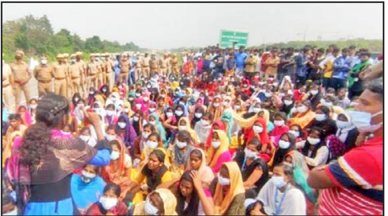
Chennai, India, 18 diciembre 2021: obreras y obreros de Foxconn protestan por comida contaminada...

Solo los comunistas tienen la perspectiva de destruir este sistema. Estamos planeando una reunión en India el próximo mes. Una sola clase obrera, un solo Partido, una sola lucha, ¡el comunismo! ¡Adelante camaradas!