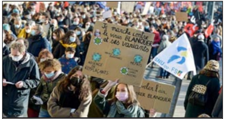
París (Francia) Enero 2022: Los docentes marchan contra el “Blancvirus” (Blanc es el Ministro de Educación de Francia) exigiendo respeto y apoyo como parte de un día de huelga

Y eso es cierto. El año pasado hubo una cantidad récord de huelgas oficiales y rebeldes (huelgas no oficiales) en los EE. UU. y en muchos otros países. Hay mucha ira por la forma en que el sistema reaccionó al virus. Ahora esas huelgas industriales se están extendiendo a las escuelas. En lugares como Oakland, los estudiantes han tomado la iniciativa y los maestros los han seguido (con huelgas rebeldes en apoyo a las demandas de los estudiantes). Los maestros han tenido