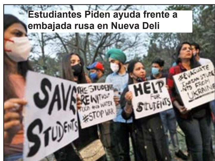
Estudiantes Piden ayuda frente a embajada rusa en Nueva Deli

“La policía fronteriza dijo que permitiría a uno