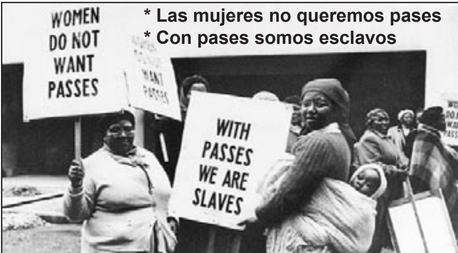
Sudáfrica 1956 - Mujeres lideran la lucha contra las leyes racistas del Apartado.