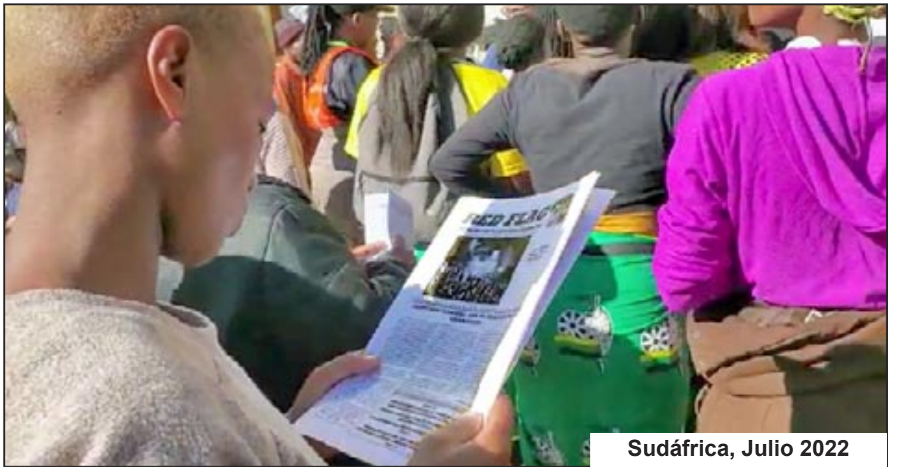
Sudáfrica, Julio 2022

ganancias en su deseo de ver el comunismo como la única respuesta para salir de los horrores de los municipios. El CNA solo está creando una ilusión de cambio y llevándolos a más ataques racistas.