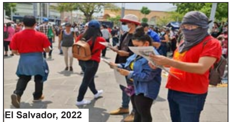
El Salvador, 2022

Camarada en las trincheras de las Maquilas