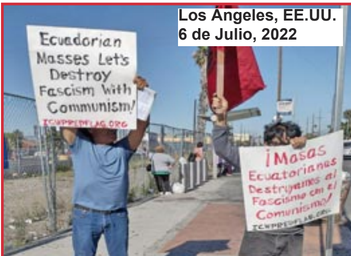
Los Angeles, EE.UU. 6 de Julio, 2022

¡Únete al PCOI para luchar por un mundo sin dinero donde nada se compre o venda, especialmente nuestra fuerza laboral, donde produzcamos colectivamente todo y lo distribuyamos según la necesidad de cada cual! ¡Un mundo comunista sin naciones ni fronteras ni capitalistas y sus ideologías venenosas!