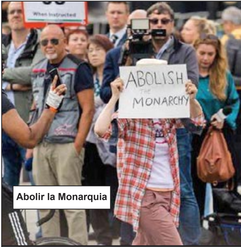
Abolir la Monarquía

¡Al diablo con la Reina y sus consortes capitalistas! Ha llegado el momento de luchar por el gobierno abierto, honesto y directo de la clase obrera que la revolución comunista traerá.