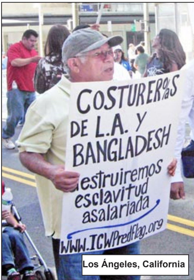
Los Ángeles, California

La formación de un colectivo del Partido en Sri Lanka creará numerosas oportunidades para desarrollar más líderes comunistas en todo el mundo.