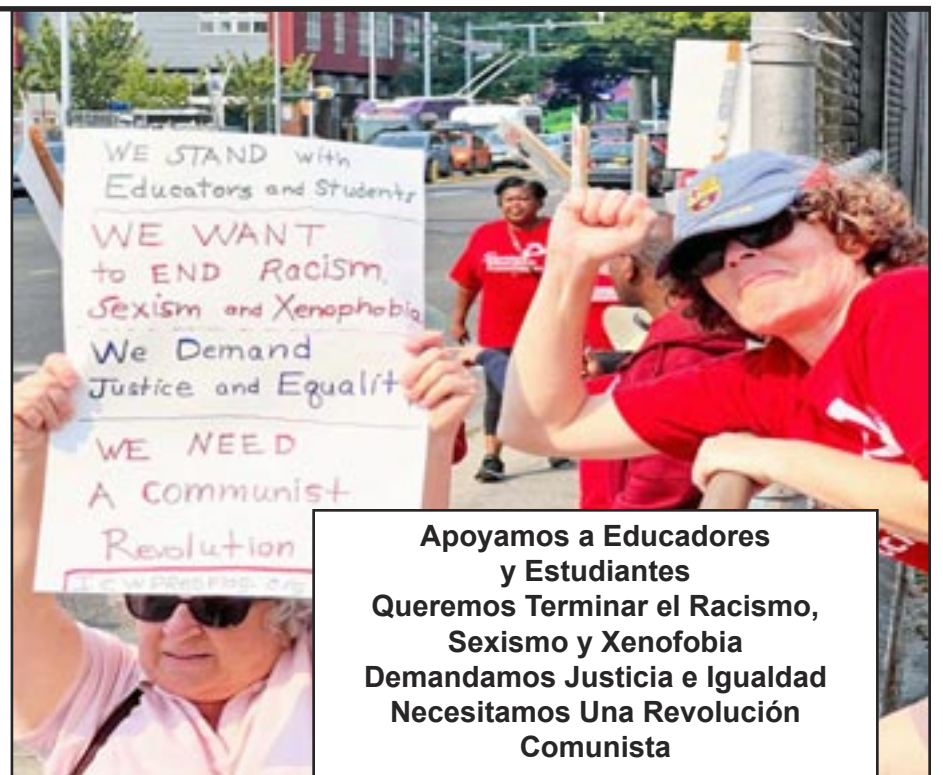
Apoyamos a Educadores y Estudiantes Queremos Terminar el Racismo, Sexismo y Xenofobia Demandamos Justicia e Igualdad Necesitamos Una Revolución Comunista

Vimos a muchos amigos de mucho tiempo, que no parecían estar avanzando políticamente, dar un paso adelante. Nuestra camarada escolar jubilada había mantenido conexiones - con otros que ahora son huelguistas - en fiestas de cumpleaños, clases de ejercicio y más. Estos amigos ayudaron al Partido a avanzar la lucha por el comunismo entre otros huelguistas, presentando a sus amigos a los camaradas, tratándonos como familia, y a veces recomendando nuestra literatura a otros.