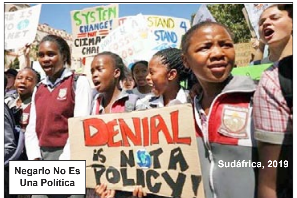
Negarlo No Es Una Política

No votes, ¡organiza para la revolución comunista! Eso realmente iniciará un nuevo día en la lucha contra la catástrofe climática.