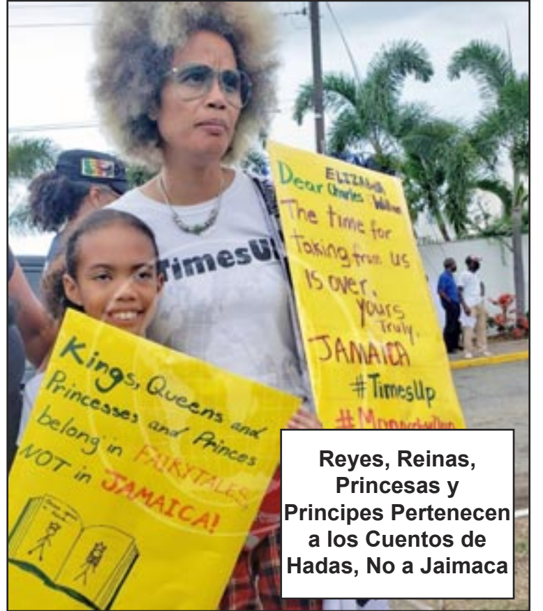
Reyes, Reinas, Princesas y Principes Pertenecen a los Cuentos de Hadas, No a Jaimaca