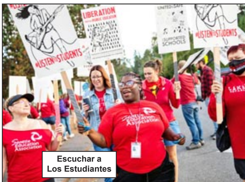
Escuchar a Los Estudiantes

Tenemos previsto seguir distribuyendo Bandera Roja y volantes sobre la educación comunista en los tres institutos del South End y en varias escuelas primarias y secundarias. Estas conversaciones continuas pueden aprovechar la respuesta de los huelguistas a nuestro comunismo, ampliar los colectivos del Partido y afinar nuestra línea.