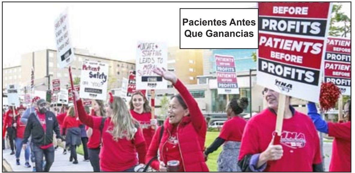
Pacientes Antes Que Ganancias

La revolución comunista, por el contrario, pondrá a los trabajadores nosotros mismos en control de nuestros lugares de trabajo y de todo lo demás. Decidiremos colectivamente cómo asignar el trabajo y organizar el trabajo. Sin embargo, antes de que eso suceda, el poder armado de los trabajadores y soldados, dirigido por ideas comunistas, debe aplastar al estado capitalista. ¡No más “oro” para gobernarnos!