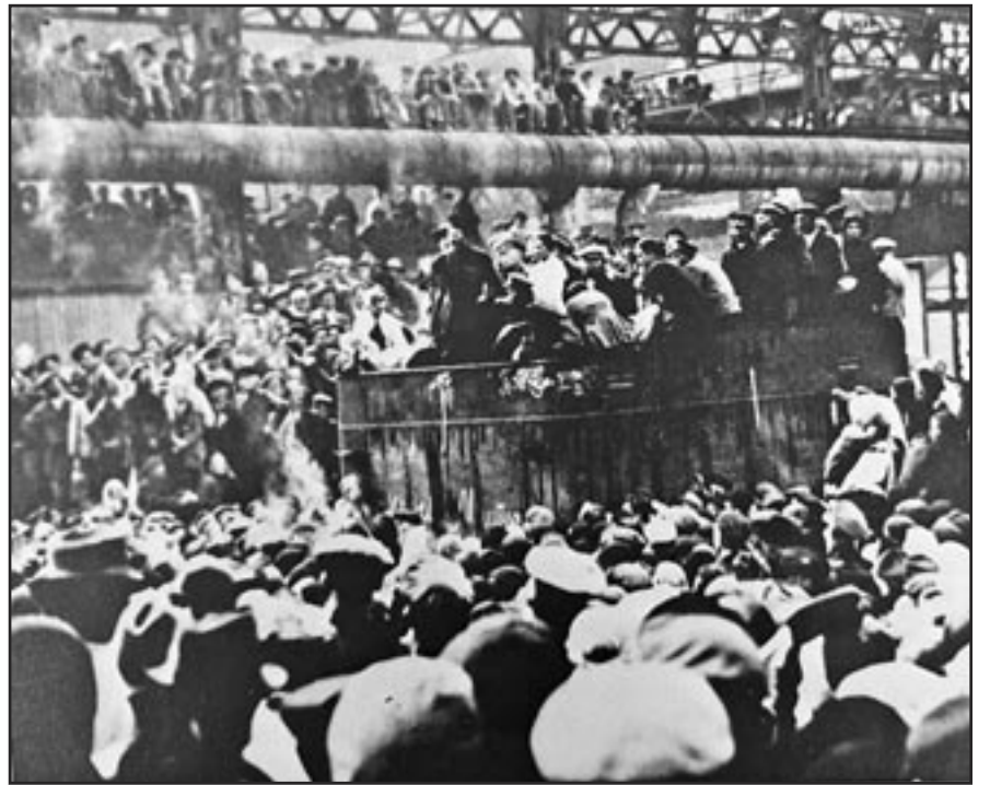
Obreros en una fábrica de Petrogrado escuchan a un soldado dar un discurso.

Catorce países imperialistas invadieron Rusia. Su objetivo era "estrangular al bebé en la cuna" destruyendo el nuevo gobierno socialista revolu-