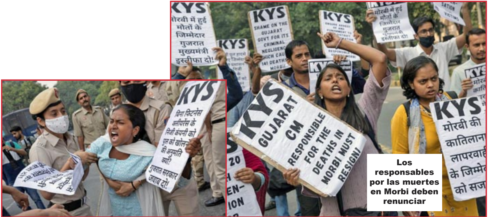
Los responsables por las muertes en Morbi deben renunciar