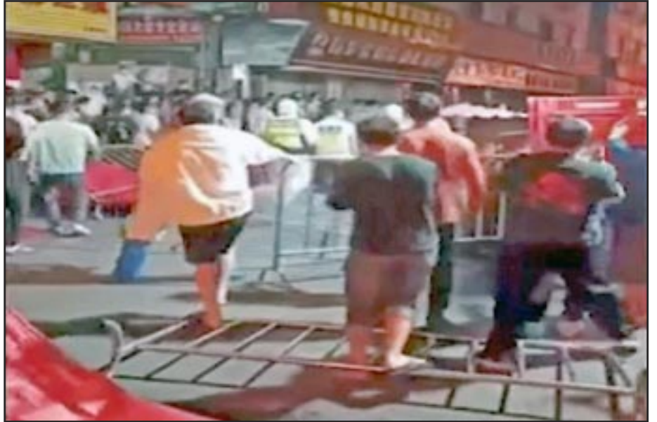
16 de noviembre- Obreras y Obreros migrantes del sector de la costura de Hubei y otros se manifestaron, derribaron barricadas en torno a los barrios residenciales y se enfrentaron a la policía en Guangzhao, el centro manufacturero del Sur de China. Protestaron contra los encierro por el Covid-19 y la falta de alimentos y otras necesidades a pesar de las promesas del gobierno.

“Las dictaduras funcionan mal en comparación con las democracias”, argumentó Nathan. “En el Reino Unido, la primera ministra Truss dimitió tras la revuelta de su partido. El presidente Putin arrastró a Rusia a una guerra cada vez más contraproducente contra Ucrania. A pesar de ello, sigue en el poder. Los rusos no tienen ningún mecanismo para destituirlo”.