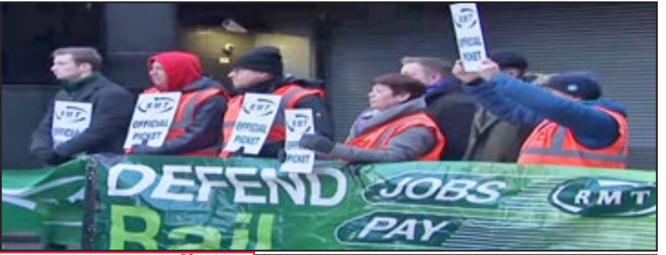
Reino Unido, enero 3: Huelguistas ferroviarios exigen aumentos para mantenerse a la par de la inflación.