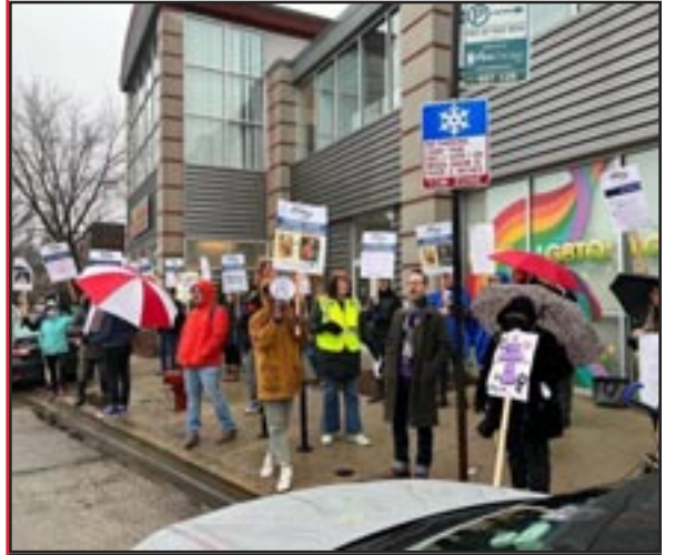
Chicago, EE.UU., 3 de enero: Los trabajadores de las clínicas Howard Brown Health se declaran en huelga contra los despidos. "Es difícil decir que es una organización que cree en la liberación cuando quiere recortar programas que sirven a la comunidad, no digamos que la comunidad a la que sirven suele ser a menudo la gente que trabaja aquí", dijo un huelguista.