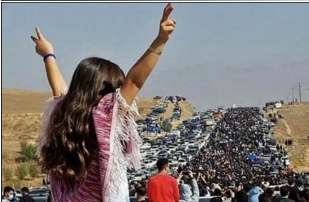
Saquez (Iran) 26 de Oct 2022- Las masas se reúnen para conmemorar Jina Mahsa Amini