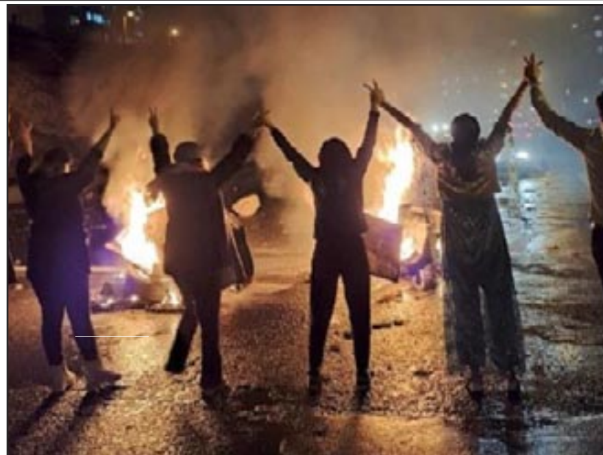
Sanandaj (Irán) 17 de Nov 2022 - Jovenes mujeres en las calles