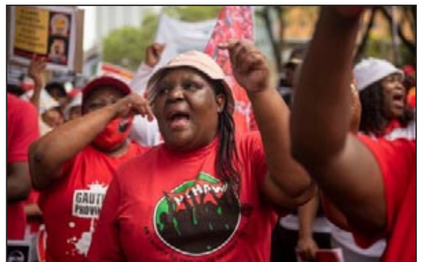
Sudafrica Noviembre 2022 Huelga de Empleados Públicos

Bandera Roja depende de todos vosotros. ¡Démonos una ronda de aplausos antes de que volvamos a las mesas de trabajo!