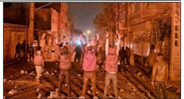
SANADAJ (IRÁN) 2 de enero del 2023—Manifestantes establecieron barricadas para protestar contra los ataques a los enlutados en Javanrud.

Sin embargo, la Primavera Árabe reveló las trágicas consecuencias de un levantamiento sin partido ni plan. El heroísmo de las masas de jóvenes y estudiantes, especialmente de las valientes mujeres y niñas, y de los trabajadores en lucha, exige un plan. Ese plan no debe limitarse a sustituir a los mulás fascistas por una coalición de opresores capitalistas.