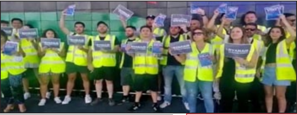
España, enero 2: Huelga de auxiliares de vuelo de Ryanair en diez grandes aeropuertos por salarios y condiciones laborales.