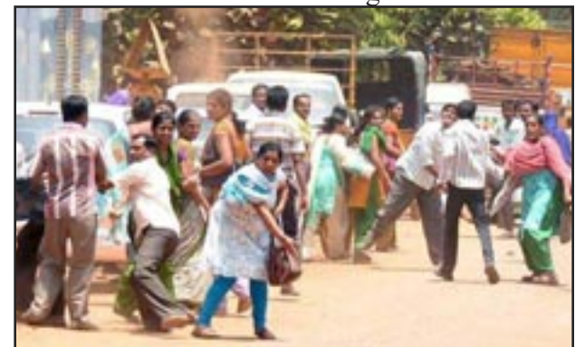
BENGALURU (INDIA) 2016— Obrerxs de las maquilas

El video termina con las palabras de las camaradas obreras de la costura (ver páf. 7) mientras se toca la Internacional en bengalí e hindi.