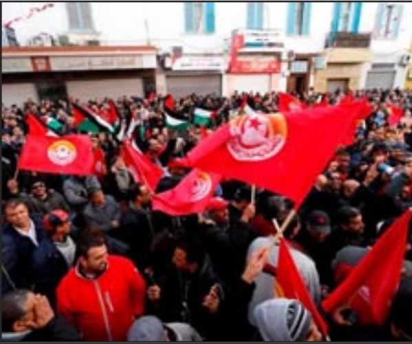
Túnez, Túnez, enero 2: Huelga de los trabajadores del tranvía y de los autobuses por los retrasos en pagarles y en el aguinaldo de fin de año.