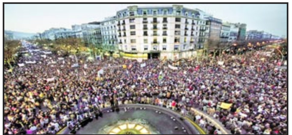
Barcelona, 15 de febrero, 2003: No a la guerra contra Irak

15 de febrero, 2003: Hace 20 años, más de 12 millones de personas marcharon en casi 800 ciudades de todo el mundo exigiendo “¡No a la guerra de EEUU contra Iraq!”. El imperialismo estadounidense invadió Iraq de todos modos. Mientras las masas marchaban, las tropas ya estaban en camino.