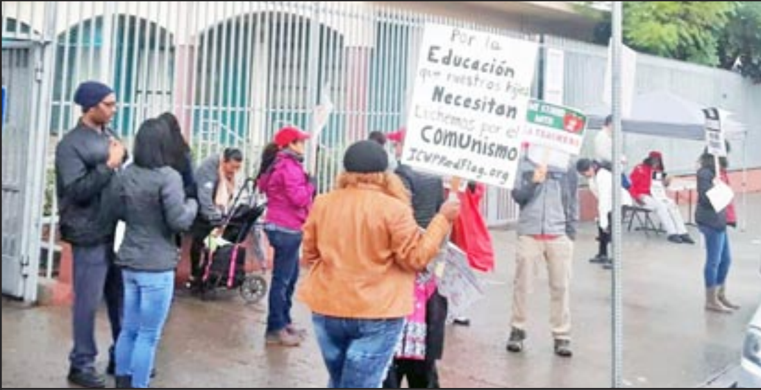
Los Angeles 2019, Huelga de maestros

-Profesor camarada en Los Ángeles (EEUU)