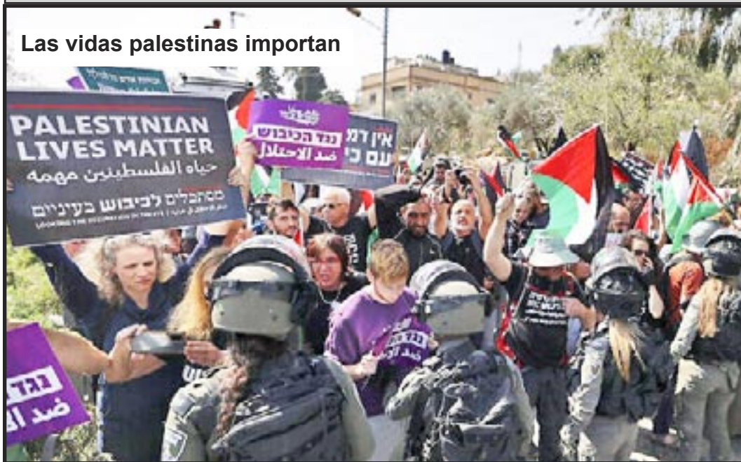
Las vidas palestinas importan

Ahora que han tocado a las mujeres, Han chocado con una roca, Han desalojado una peña, Serán Aplastados