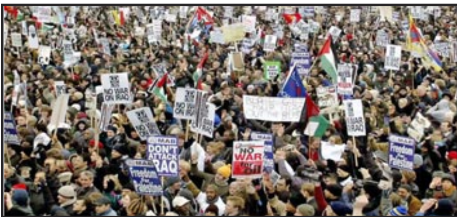
Londres, 15 de febrero, 2003: No a la guerra contra Irak

Las masas trabajadoras nos convertiremos en la fuerza dirigente del mundo, barreremos a los imperialistas y sus guerras e inauguraremos un brillante futuro comunista.