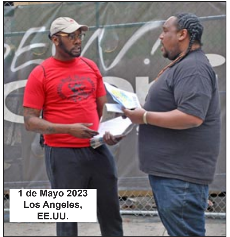
1 de Mayo 2023 Los Angeles, EE.UU.

“Es cierto”, coincidió F. Lo que le impresionó a ella fue su colectividad en trabajar y, aún más, su amplia formación política. “Pude asistir a una reunión de masas en la que discutían los acontecimientos mundiales, primero en lengua indígena