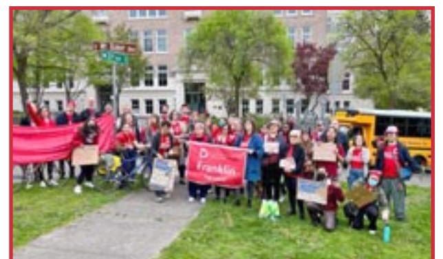
Seattle (USA) página 4