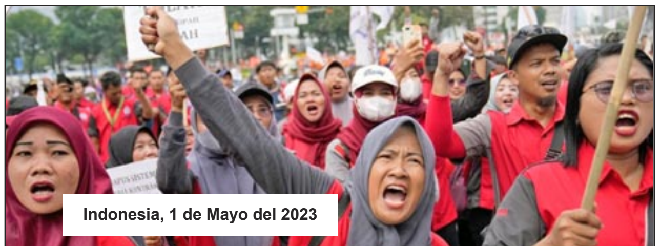
Indonesia, 1 de Mayo del 2023