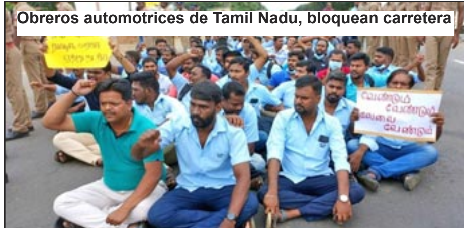
Obreros automotrices de Tamil Nadu, bloquean carretera

En general, nuestro Primero de Mayo ha abierto muchas oportunidades para reclutar más trabajadores y soldados para nuestro Partido.