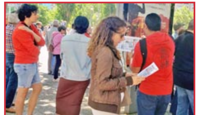
España, página 5