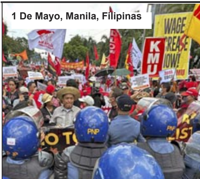
1 De Mayo, Manila, Filipinas

Nuestros planes para el próximo año deben responder a la pregunta: “¿Cómo están respondiendo los trabajadores a la lucha directa por el comunismo?” con un crecimiento significativo del PCOI.