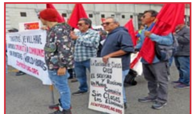
Los Angeles (USA) página 3