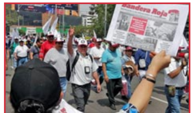
Ciudad de México