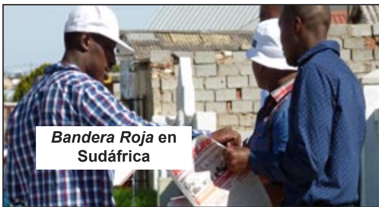
Bandera Roja en Sudáfrica

Podemos empezar movilizándolo y ganándonos a los que ya están cerca de nosotros. Esto puede crear oportunidades y condiciones para que crezcamos exponencialmente entre los trabajadores de las fábricas y otros.