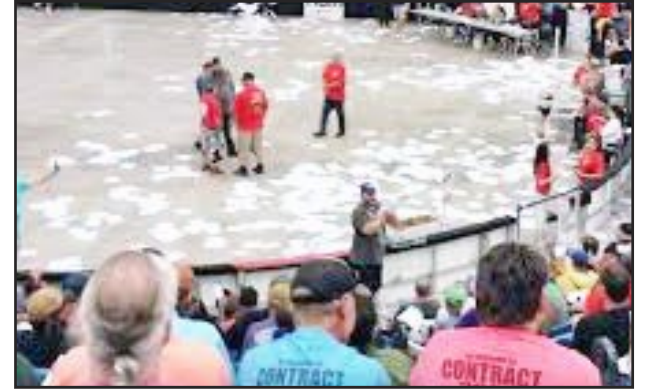
WICHITA-OBROEROS INDUSTRIALES DE SPIRIT TIRAN AL SUELO LOS CONTRATOS A LOS OFICIALES DEL SINDICATO

La clase obrera debe liberarse de las cadenas patronales y construir un mundo colectivo. El PCOI anima a los obreros de Spirit a mantener su postura de lucha y a unirse a nuestro Partido para destruir el capitalismo.