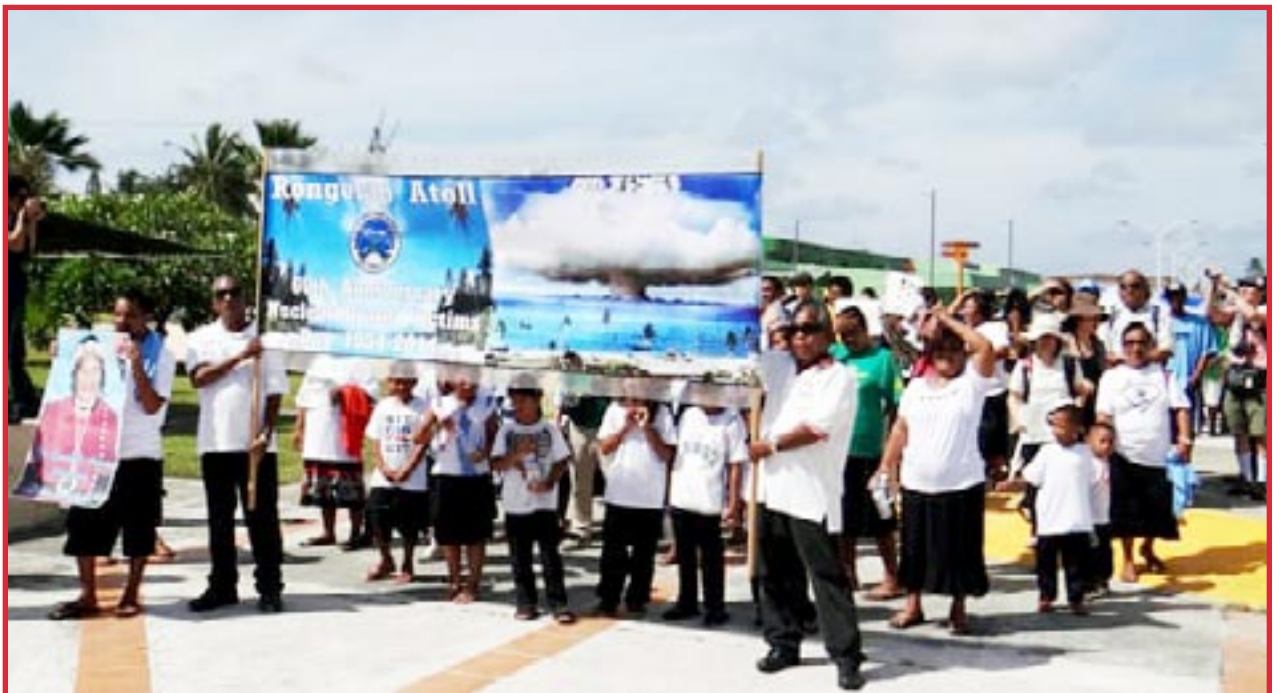
1° de marzo de 2014: Los isleños de las Marshall protestan en el 60 aniversario de la prueba estadounidense de la bomba de hidrógeno que destruyó el Arrecife de Bikini.

Ni el chantaje nuclear ni la guerra nuclear impedirán que la clase trabajadora liderada por los comunistas haga la revolución.