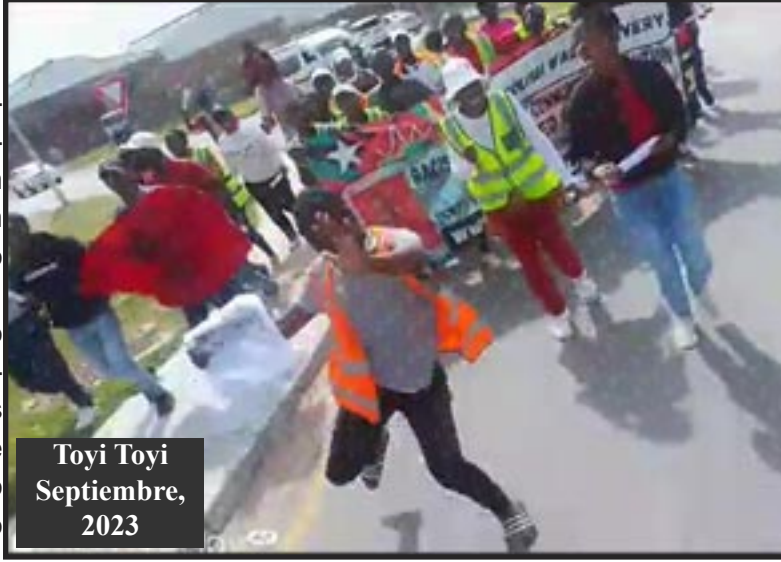
Toyi Toyi Septiembre, 2023

Dije: “La única manera de que terminen todos