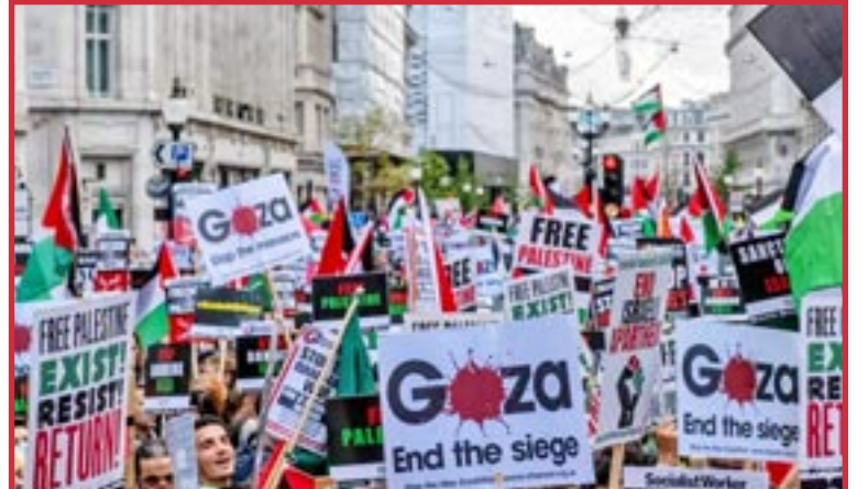
Londres, 14 de Octubre

Los camaradas en Sudáfrica están convirtiendo su indignación por el genocidio en Palestina en un reclutamiento más enérgico para el PCOI. Debemos hacer eso en todas partes.