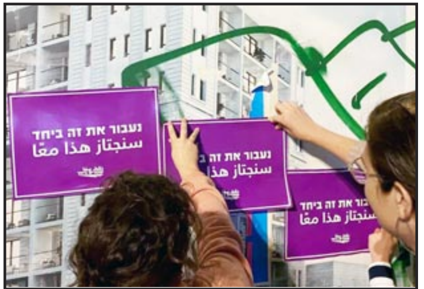
Jerusalén, 10 de octubre: Activistas del movimiento pacifista judío-árabe Standing Together (Parados Juntos), colocan carteles que dicen “Judíos y árabes, juntos superaremos esto”. A dos de ellos, un judío y un árabe, los arrestaron y les confiscaron sus carteles.

Distribuimos más de 700 volantes y 500 copias