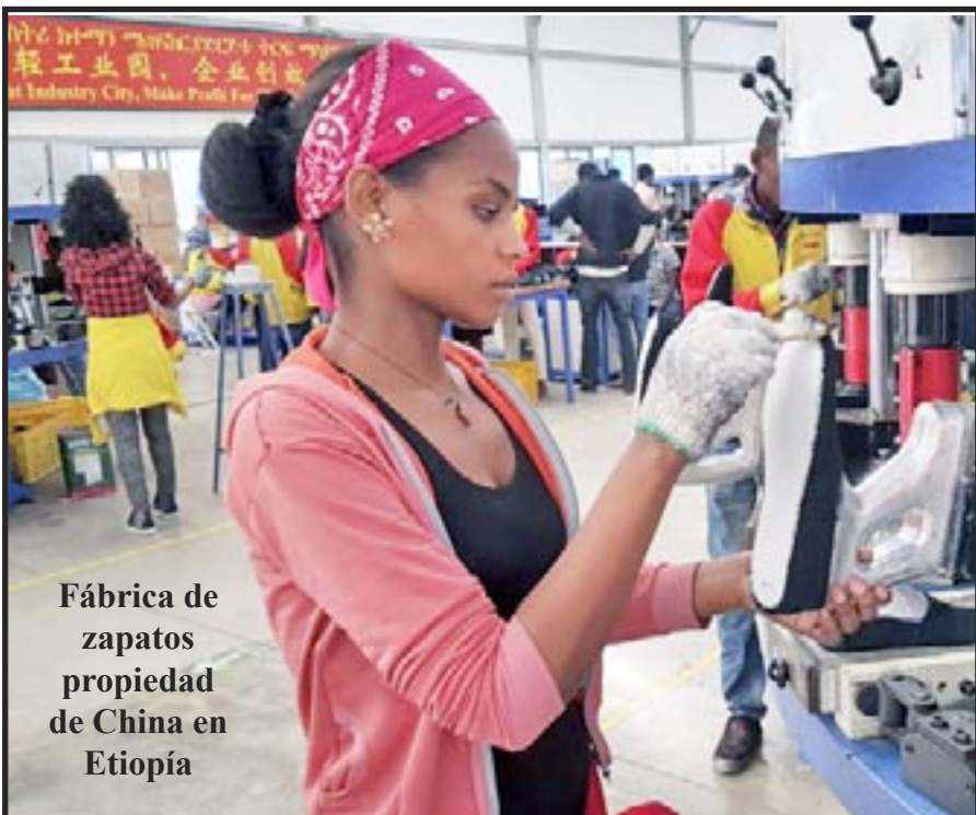
Fábrica de zapatos propiedad de China en Etiopía

El nacionalismo, racismo y fascismo de los patrones no serán rivales para una clase obrera unida que lucha por el poder comunista de los trabajadores. ¡Juntos venceremos!