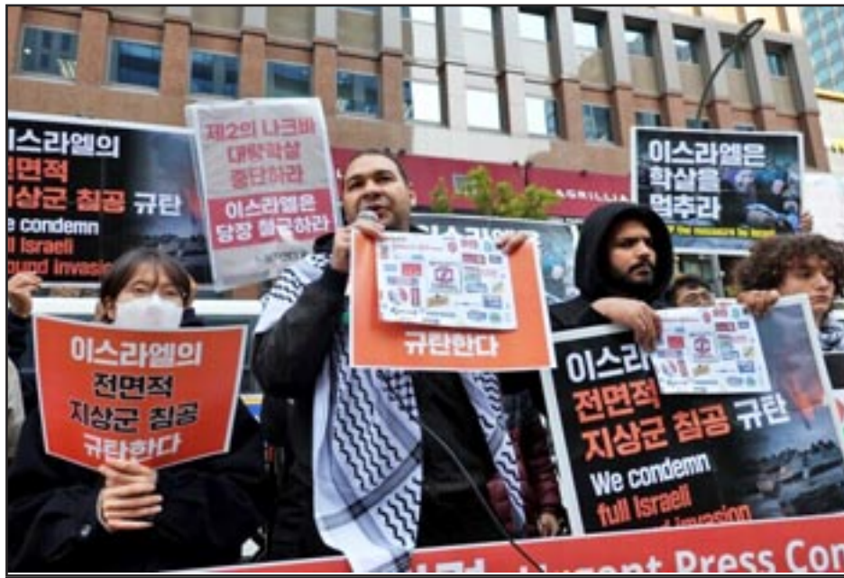
Seúl, Corea del Sur—Activistas, incluidos hablantes de lengua árabe, condenan la invasión militar israelí de Gaza

El Imperio Otomano fue derrotado en la Primera Guerra Mundial. Los imperialistas británicos y franceses se dividieron el botín. Los imperialistas británicos y estadounidenses alentaron y utilizaron el movimiento sionista para construir una “patria judía” en lo que había sido principalmente el hogar de los palestinos.