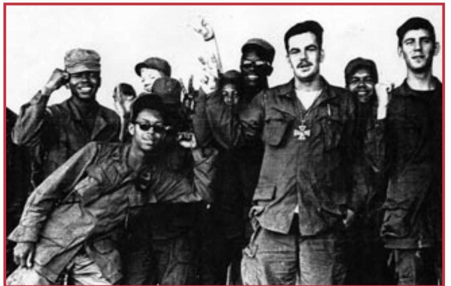
Soldados estadounidenses rebeldes en Vietnam hicieron imposible que el ejército del gobierno de EEUU fuera confiable

Bandera Roja agrega: Un soldado en Port Elizabeth, Sudáfrica, distribuye Bandera Roja a su unidad. Dice que el genocidio de Gaza está haciendo que más soldados vean nuestra línea de reclutamiento de comunistas. “Los patronales son impotentes si nos negamos a pelear por ellos”. Sigamos su ejemplo reclutando más soldados de los ejércitos patronales de todas partes. Tenemos que construir un Ejército Rojo unido. Ni Hamás ni las FDI pueden lograr la paz. Son enemigos de la clase obrera. Construyamos un poderoso PCOI de soldados rojos para liberar a la clase obrera de la esclavitud asalariada y el genocidio.