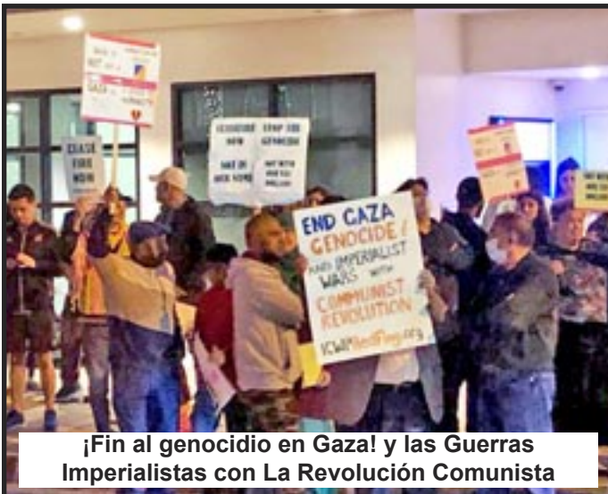
¡Fin al genocidio en Gaza! y las Guerras Imperialistas con La Revolución Comunista

Gaza le ha causado una muerte y una destrucción horribles a la clase trabajadora. Pero organizaremos a los trabajadores y soldados para destruir a nuestros enemigos de clase y triunfar con la revolución comunista.