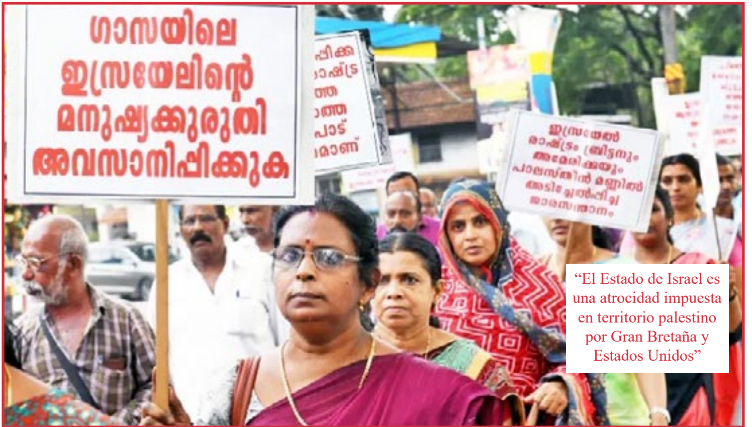
“El Estado de Israel es una atrocidad impuesta en territorio palestino por Gran Bretaña y Estados Unidos”

KERALA, INDIA: PONER FIN A LAS ATROCIDADES DE ISRAEL EN GAZA