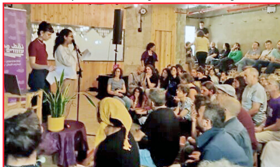
Cientos Asisten a Reunión Comunitaria Dirigida por Movimiento Juntos de Pie, Jerusalén, Noviembre 2023

“La gente está furiosa”, dijo un amigo judío israelí antifascista. Se están abriendo grandes grietas tanto en la clase obrera como entre los soldados. Los horrores del genocidio han encendido un odio masivo contra Netanyahu. Incluso antes de la guerra, él estaba cada vez más aislado y se volvía más peligroso a medida que las marchas masivas rechazaban sus políticas expansionistas, autoritarias y de extremismo religioso.