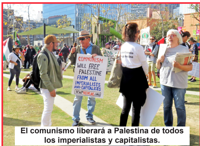
El comunismo liberará a Palestina de todos los imperialistas y capitalistas.