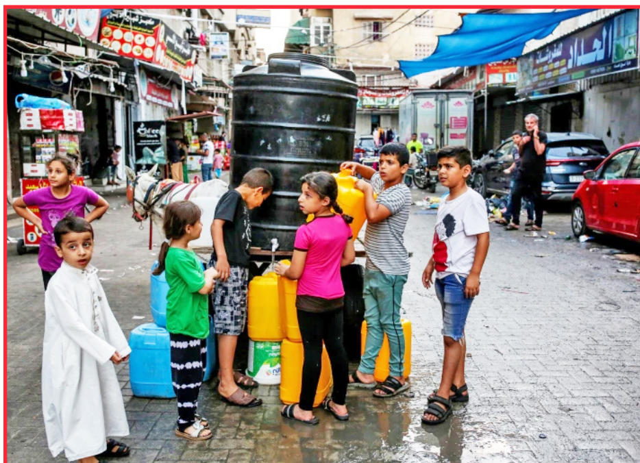
Khan Younis, Gaza