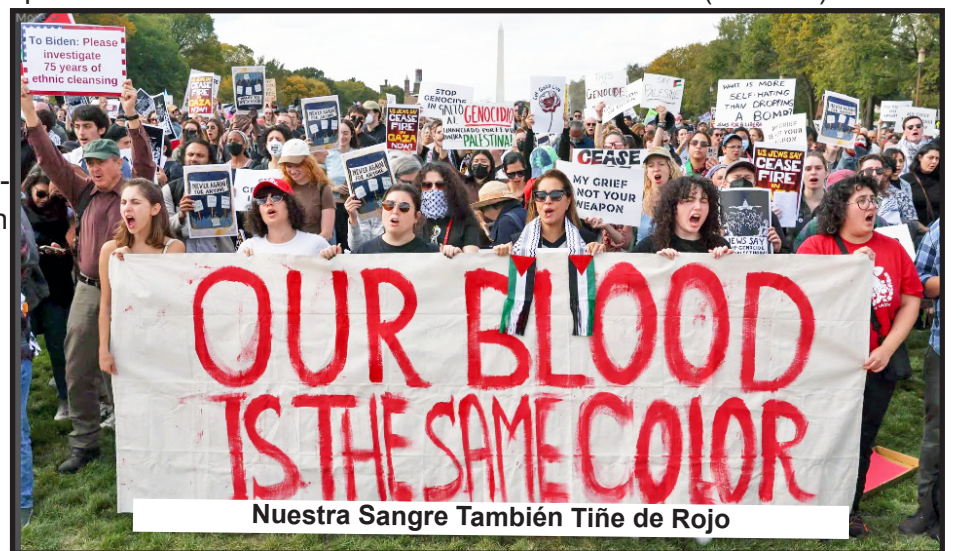
Nuestra Sangre También Tiñe de Rojo Washington, D.C., Protestas Encabezadas por Jóvenes Judíos Exigen El fin del Genocidio en Gaza.