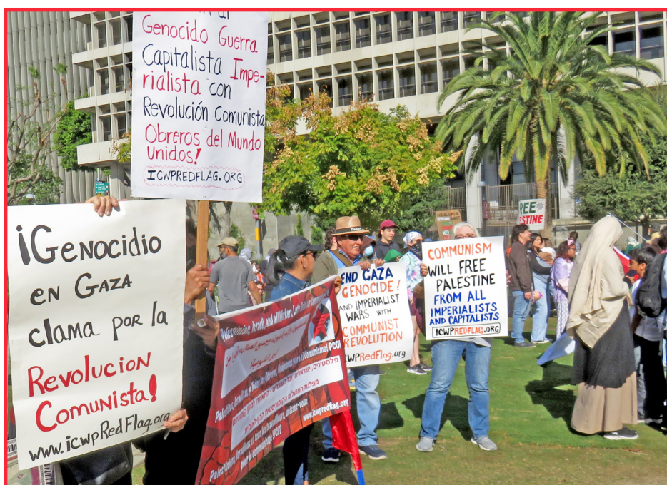
Los Ángeles, EE.UU.