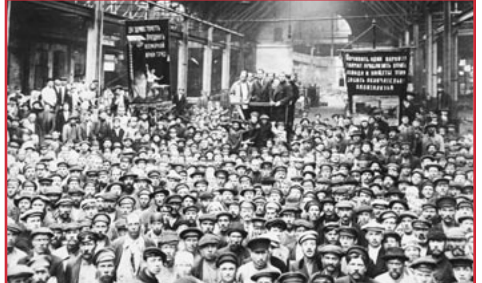
Nuevas elecciones al Soviet de Petrogrado en la fábrica de Putilov, 1917. La pancarta de la izquierda dice: "Viva el Partido del Ejército Universal del Trabajo". La pancarta de la derecha dice: "Crear una locomotora significa acercar el fin del hambre y la miseria, así como dar un golpe final al capitalismo"

Los obreros de la fábrica Putilov publicaron una resolución expresando su apoyo al Comité Militar Revolucionario. El establecimiento de este comité militar esencialmente entregó