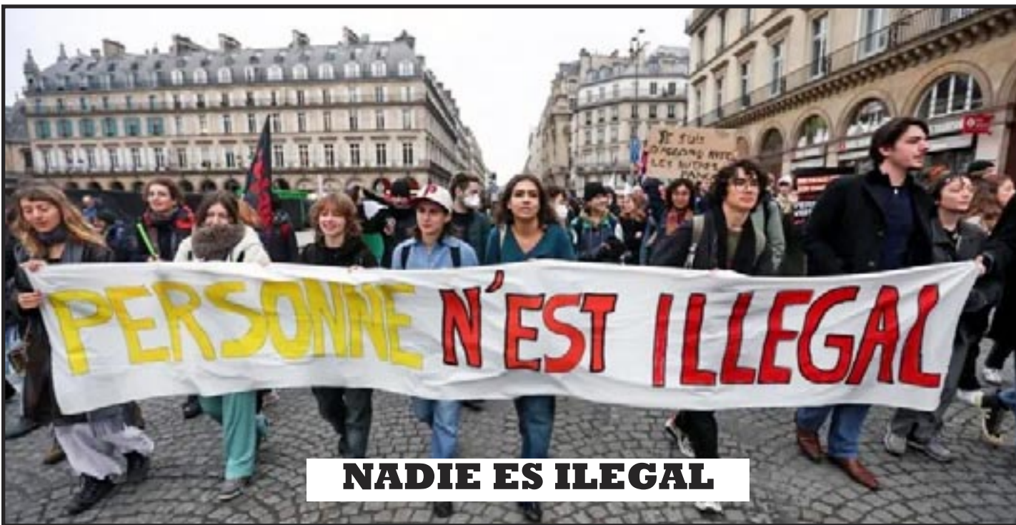
Paris, Francia, Enero 2024

Es necesario formar colectivos del Partido Comunista Obrero Internacional por todo el mundo y movilizar a las masas para la revolución comunista, de esta manera haremos de esto una realidad.