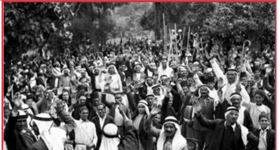
Abou Ghosh, Palestina, 1937. Los trabajadores votan a favor de una huelga general contra el dominio británico. Esta huelga se convirtió en la Revuelta Árabe que paralizó a todo el país. Fue brutalmente aplastada por el ejército británico, ayudado por Haganá y Irgun, grupos paramilitares sionistas que más tarde se convirtieron en la base de la Fuerza de “Defensa” Israelí.

Ataques fascistas similares tienen lugar hoy en día. Los colonos desplazan violentamente a las familias palestinas de sus hogares en Cisjordania. Las turbas impiden que los camiones entreguen ayuda vital a los niños hambrientos en Gaza. Tur-