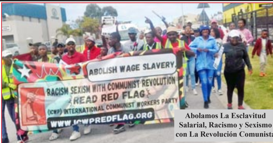
Abolamos La Esclavitud Salarial, Racismo y Sexismo con La Revolución Comunista

SUDÁFRICA: CONSTRUYENDO UN PCOI MASIVO, PÁGINA 2