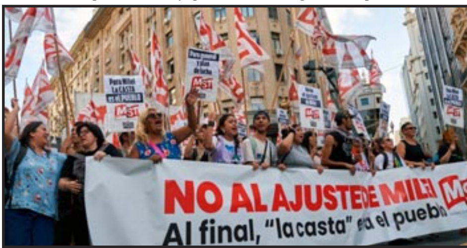
Buenos Aires, 20 de Diciembre 2023

El movimiento comunista nunca se ha acobardado ni se acobardará ante el crecimiento del fascismo. Construiremos un PCOI de masas para unir a las masas y ponerle fin junto con sus creadores capitalistas-imperialistas.