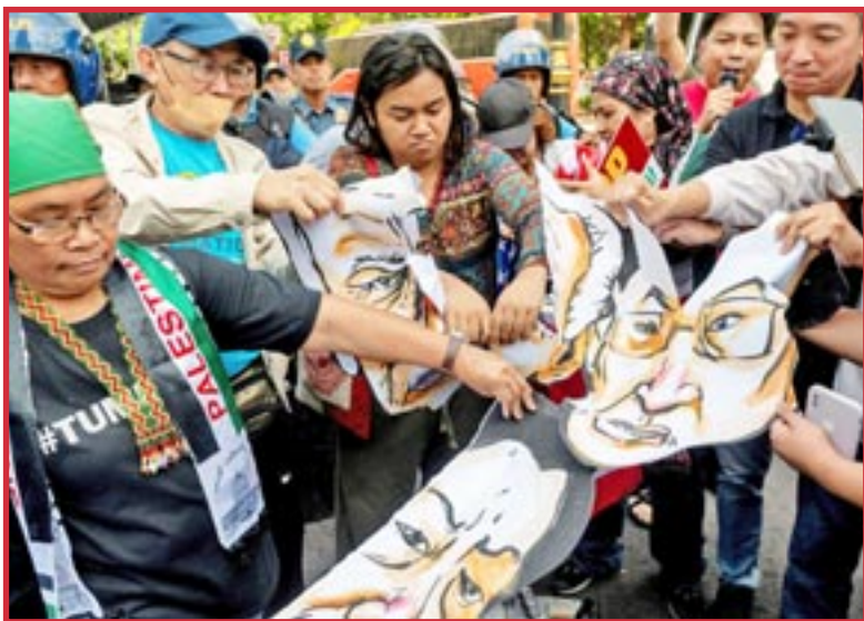
11 de abril 2023, Manifestantes Contra La Cumbre Trilateral en Filipinas Rompiendo Fotografías de Biden, Marcos y Kishida.

El PCOI está construyendo más relaciones de este tipo. Abrirán el camino a la revolución comunista en el futuro y pondrán fin al “consejo de guerras” del capitalismo y a la explotación brutal de las potencias imperialistas.