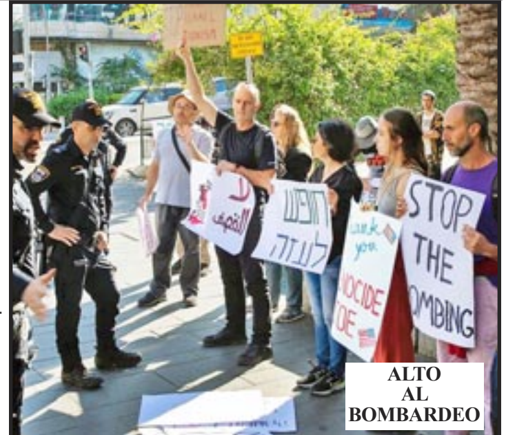
ALTO AL BOMBARDEO La Policía Reprime Una Protesta Contra La Guerra de Israel en Gaza, Haifa (Israel), 15 de Diciembre 2023