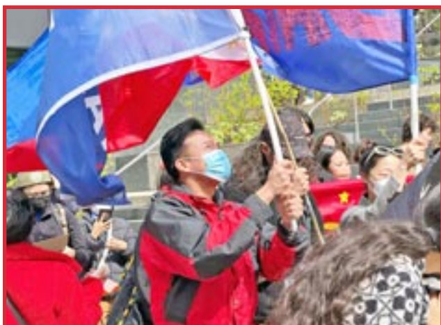
11 de abril, 2023 Trabajadores y Estudiantes en el Edificio Federal en Seattle (EE.UU.) Protestando por la Cumbre Trilateral

A los estudiantes les interesa convertirse en trabajadores industriales, donde hay oportunidades para construir relaciones comunistas en la clase obrera industrial. La historia ha demostrado el potencial de estos lazos en la construcción de una revolución para el comunismo. Las escuelas de oficios y los colegios comunitarios son un terreno fértil para este trabajo. El capitalismo en crisis ha creado esta oportunidad, y debemos aprovecharla.