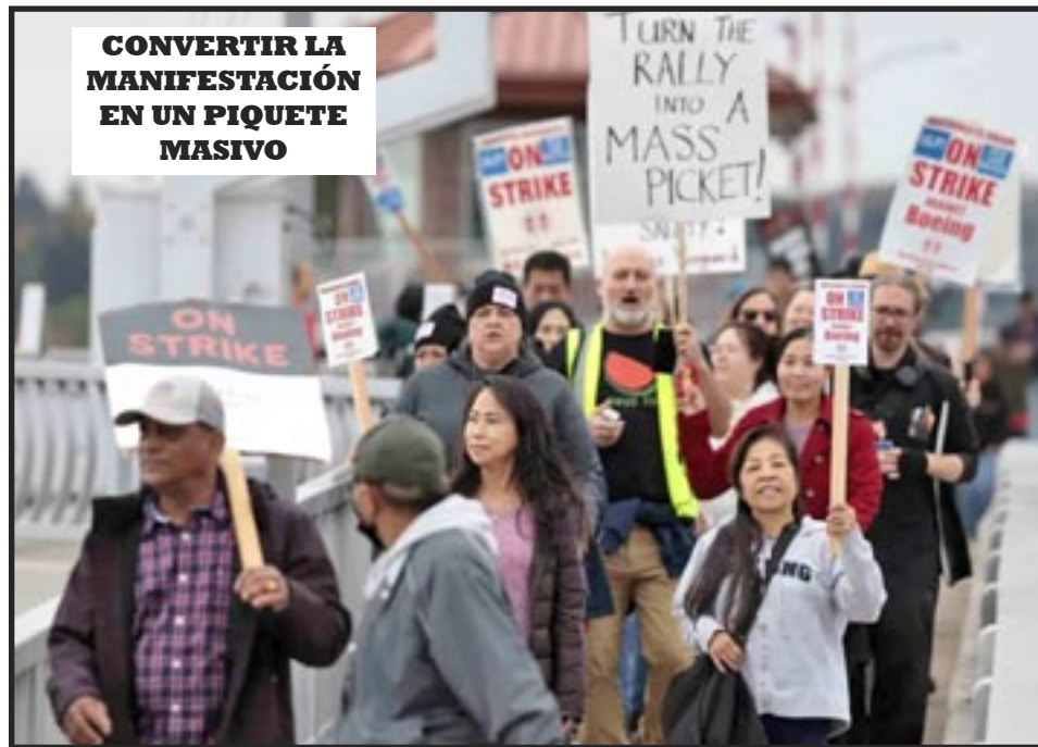
CONVERTIR LA MANIFESTACIÓN EN UN PIQUETE MASIVO

Sabe que, en respuesta a multimillonarios como Robby Starbuck y Elon Musk, los ejecutivos de Boeing han abandonado programas destinados a contratar una fuerza laboral diversa. Esto hará que sea especialmente difícil para los nuevos obreros (mujeres, hijos de inmigran-