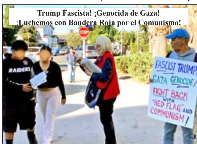
LOS ÁNGELES (EE. UU.), 4 de noviembre— Casi 400 estudiantes de 2 escuelas secundarias aceptaron con gusto Bandera Roja (BR) esta semana. Los intentos anteriores en una escuela para intimidar a los estudiantes parecen haber fracasado. Nos quedamos sin volantes y BR. Volveremos la próxima vez con más periódicos. Animamos a los jóvenes a compartir nuestras ideas comunistas con sus maestros, padres y compañeros de clase. Los jóvenes han desempeñado un papel clave en los movimientos revolucionarios de masas. Armados con ideas comunistas, cuando se conviertan en obreros y soldados, pueden poner fin al racismo y la explotación capitalistas y al genocidio imperialista para siempre.