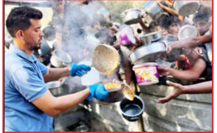
13 de noviembre: El comedor social de Gaza dirigido por voluntarios en Al Zawaida sigue sirviendo comida y entregando agua en condiciones increíblemente difíciles: “Juntos, seguimos avanzando, asegurándonos de que nadie se quede sin recursos esenciales, sin importar cuán difícil sea el viaje”.

La única manera de acabar con la superexplotación y opresión racistas-imperialistas es la revolución comunista para ponerles fin a TODOS los gobernantes capitalistas-imperialistas y al capitalismo mismo. Necesitamos construir el comunismo. No naciones capitalistas “independientes”. No socialismo que es capitalismo de Estado. El socialismo mantiene el sistema salarial, la compra y venta y el dinero, mientras crea una nueva clase dominante capitalista. En el comunismo, las relaciones colectivas comunistas reemplazarán al