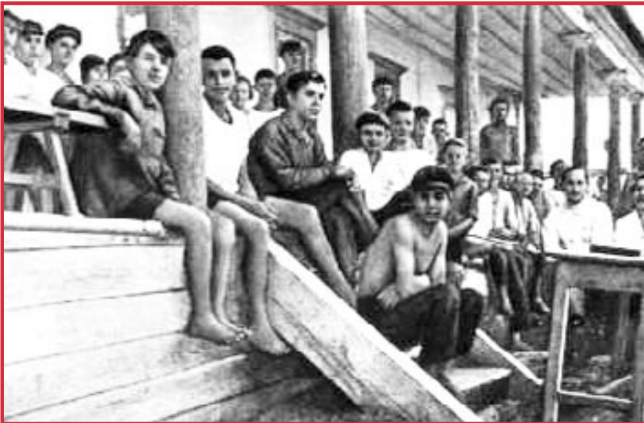
Poco después de la Revolución Rusa, los comunistas fundaron la Colonia Gorki. Los jóvenes, que antes vivían en la calle, crearon un colectivo. Pudieron ver una "naturaleza humana" diferente a través del trabajo y el estudio en conjunto.

La única manera de derrotar las mentiras sindicales es difundir la política comunista, construyendo relaciones personales y políticas en medio de la lucha de clases. Esto no es un esfuerzo individual. Es una campaña para construir colectivos partidarios sólidos como una roca para liderar la lucha por la revolución comunista.