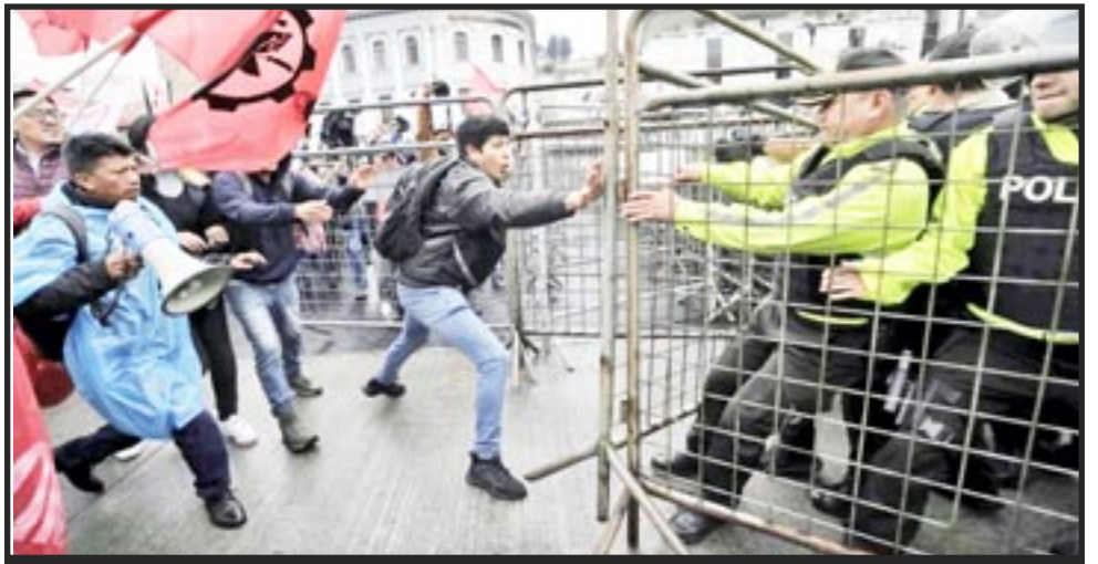
ECUADOR, noviembre 15, 2024 -Trabajadores en Quito exigiendo electricidad combaten con la policía. Estos y todos los trabajadores necesitamos luchar por el comunismo, el único sistema que puede satisfacer todas nuestras necesidades.

El gobierno ecuatoriano trabaja para las empresas energéticas, no para la clase obrera. De hecho, ignora que durante las últimas décadas se han desarrollado muchas tecnologías regenerativas alternativas: El uso fotovoltaico del sol, el uso eólico del viento,