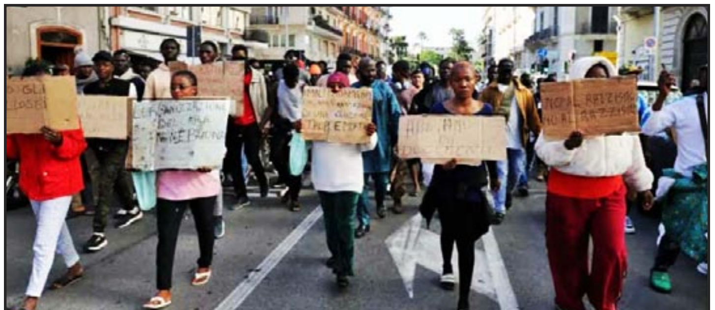
Bari, Italia, noviembre de 2024— Protestando las condiciones en un centro de detención de migrantes donde un migrante había fallecido recientemente por no recibir la atención médica adecuada.

Debemos establecer un mundo comunista donde la producción se organice colectivamente en función de las necesidades y no del lucro, y los trabajadores no necesiten recibir dinero o migajas para poder pagar por nuestras necesidades.