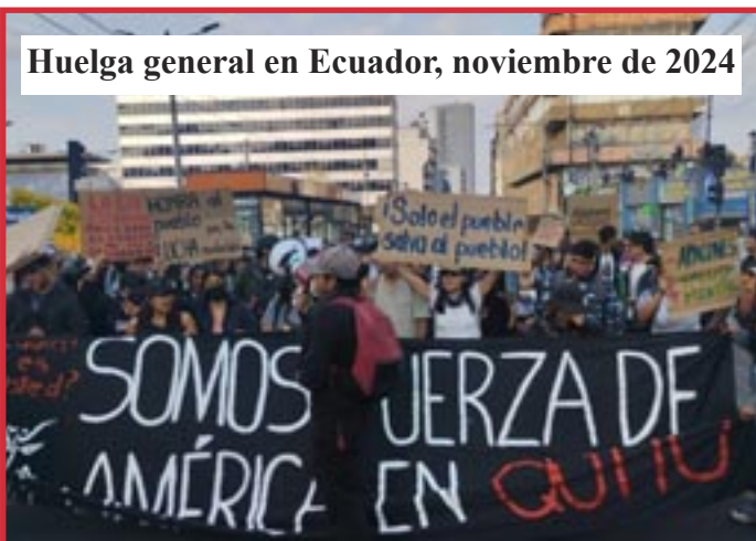
Huelga general en Ecuador, noviembre de 2024

El trabajo que hacemos hoy para construir el PCOI entre estos sectores claves puede permitirnos crecer rápidamente y movilizar a las masas para el comunismo en muchos países, ¡posiblemente antes de lo que pensamos!