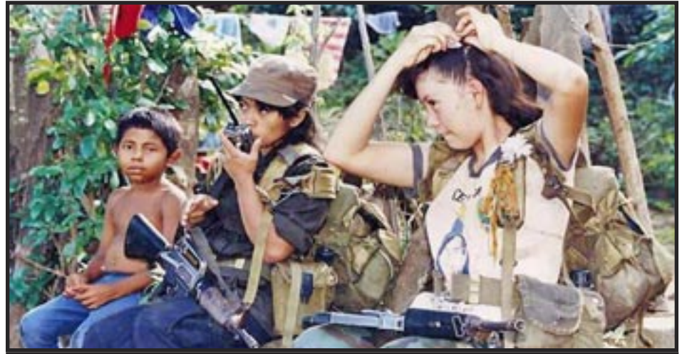
EL SALVADOR— Mujeres guerrilleras durante la Guerra Civil 1980 Clase trabajadora base del Ejército Rojo

En este ambiente de guerra y genocidio el PCOI ha hecho un importante trabajo: distribuir la literatura comunista, hacer contactos, y poner la línea del Partido al alcance de las masas. Nuestra base se va consolidando en el