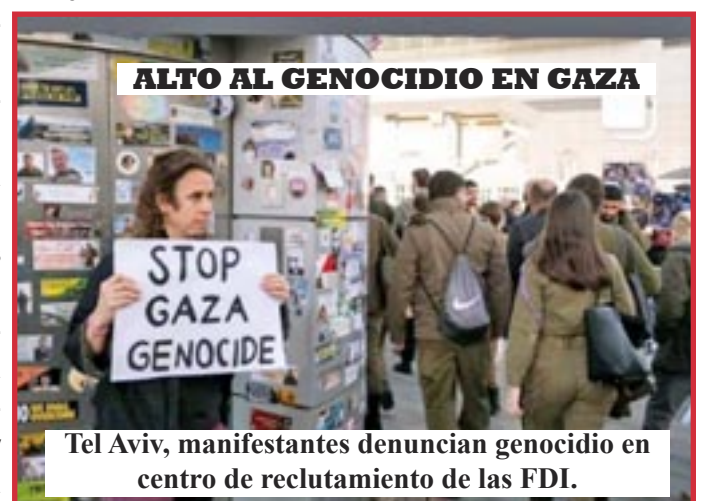
Tel Aviv, manifestantes denuncian genocidio en centro de reclutamiento de las FDI.