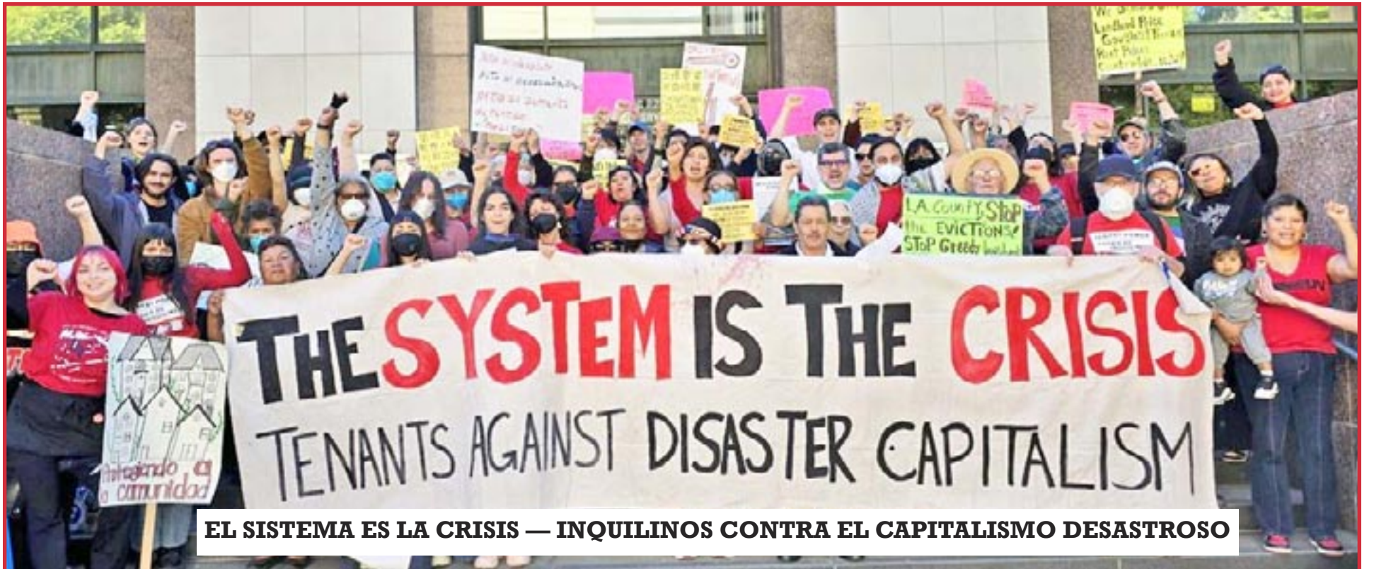
EL SISTEMA ES LA CRISIS — INQUILINOS CONTRA EL CAPITALISMO DESASTROSO

PARTIDO COMUNISTA OBRERO INTERNACIONAL ☆ WWW.ICWPREDFLAG.ORG