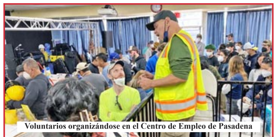
Voluntarios organizándose en el Centro de Empleo de Pasadena

Eso significa construir el PCOI. Por favor, conéctate con nosotros. Únete y contribuye con tus ideas, tu energía y tus habilidades.