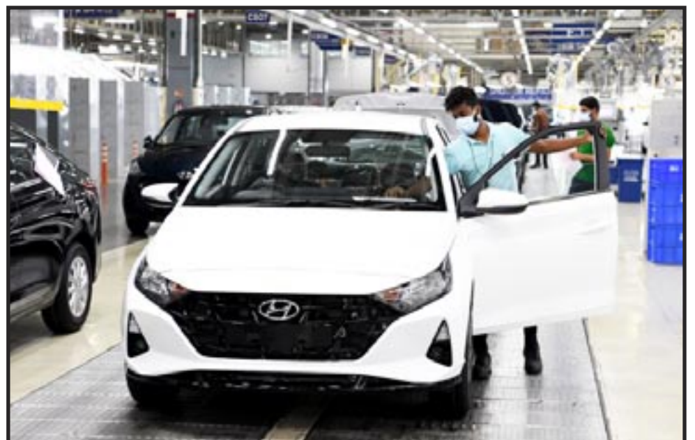
Fábrica de Hyundai en Chennai, India.

La naturaleza del capitalismo requiere obtener máximas ganancias, destruye las empresas capitalistas más pequeñas. En la industria de los vehículos eléctricos, los capitalistas más grandes compran a los capitalistas más pequeños y eliminan a los que no pueden competir. El mayor mercado de VE está dominado por BYD en China y Tesla en los EE. UU. Cientos de empresas, como Hyundai, están tratando de competir. Esta sobreproducción global de autos conducirá a la guerra.