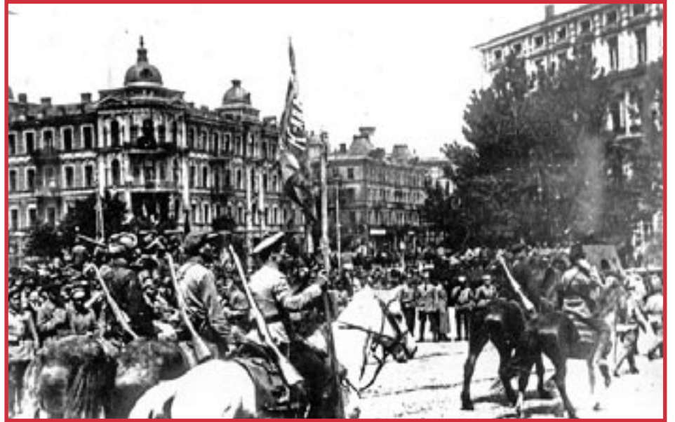
Tropas del Ejército Rojo bolchevique marchan en Kiev, 1920.

Los marineros de Kronstadt rechazaron la ayuda de los emigrados. Esperaban recibir apoyo de los obreros y campesinos de toda Rusia. No llegó. Los líderes soviéticos intentaron neutralizar políticamente a los marineros. Luego, las tropas bolcheviques sofoca-