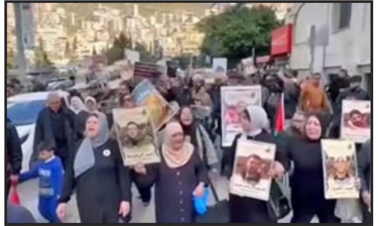
Cisjordania, 31 de marzo de 2026 — Los palestinos protestan contra la decisión del gobierno sionista de imponer la pena de muerte a los prisioneros palestinos.

Pero ¿qué pasa cuando acumulamos pacientemente pequeños avances en la comprensión que la gente tiene de la sociedad capitalista? ¿Y de la sociedad