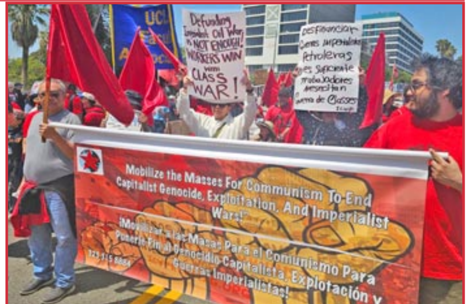
Primero de Mayo, Los Ángeles (EE. UU.) 2026

La lucha por la salud es también lucha de clases. No basta con pedir reformas: es necesario organizarse y combatir el sistema que convierte el sufrimiento humano en negocio. Es necesario poner fin a este sis-