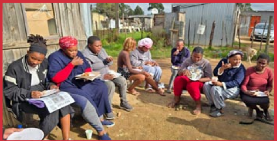
Sudáfrica, mayo de 2026

Ver SUDÁFRICA, APRENDER LA REVOLUCIÓN COMUNISTA, Pág. 4