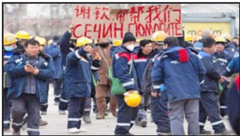
Krai de Jabárovsk (Rusia), 12 de abril —Cientos de trabajadores de la construcción chinos reclamaron a la empresa contratista rusa Petro-Hehua el pago de los salarios atrasados. Se trata de una filial del grupo industrial chino Haihua Industry. Estaban construyendo una unidad de producción de combustible en una refinería de Rosneft situada cerca de la frontera nororiental de China. Posteriormente, algunos de ellos organizaron una sentada en un parque cercano.

Por el contrario, las masas de todo el mundo deben unirse, trascendiendo fronteras y naciones, líneas étnicas y religiosas, así como divisiones raciales y ancestrales, para construir el PCOI. Deben movilizarse en favor del comunismo y crear las condiciones necesarias para la revolución, con el fin de edificar un mundo comunista, libre de la dominación capitalista. Un mundo en el que la humanidad prospere trabajando unida y cuidando los unos de los otros.