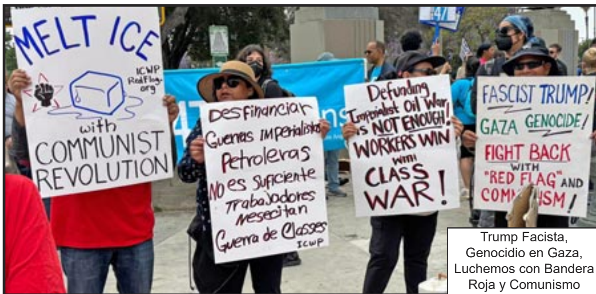
Primero de Mayo, Los Ángeles (EE.UU.) 2026

Trump Facista, Genocidio en Gaza, Luchemos con Bandera Roja y Comunismo