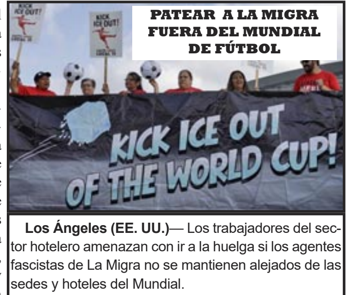
PATEAR A LA MIGRA FUERA DEL MUNDIAL DE FÚTBOL Los Ángeles (EE. UU.)— Los trabajadores del sector hotelero amenazan con ir a la huelga si los agentes fascistas de La Migra no se mantienen alejados de las sedes y hoteles del Mundial.