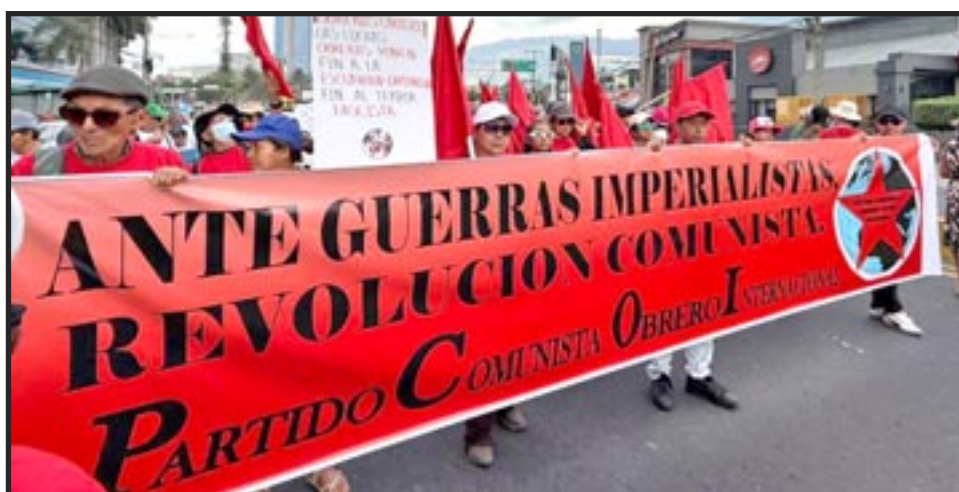
Primero de Mayo, San Salvador, El Salvador 2026