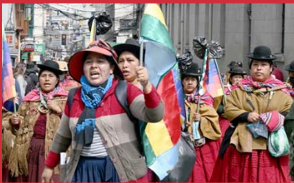
Bolivia, las masas en lucha, ver página 5