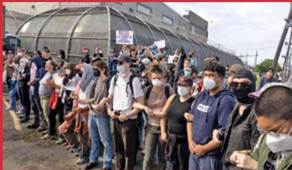
Newark, Nueva Jersey (EE.UU.)