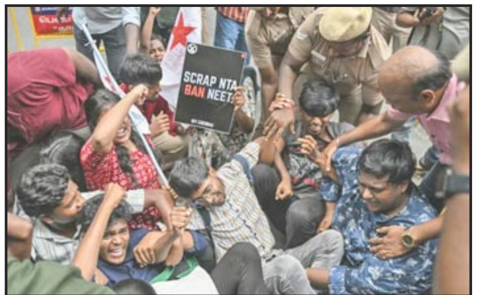
Chennai, India, 14 de mayo de 2026

Compartimos la comida, el techo y nuestras ideas comunistas”.