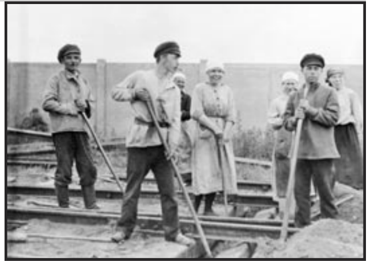
Trabajadores ferroviarios soviéticos, 1922

Eso ocurrió en 1917, en las luchas revolucionarias contra el zar. Luego, contra el gobierno capitalista de Kerenski. Y más tarde, cuando promovieron sin éxito una “tercera revolución” contra