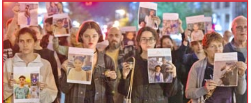
Tel Aviv, Palestina ocupada, 2025 — Manifestantes contra el genocidio en Gaza sostienen fotografías de niños palestinos asesinados por el ejército de Israel.

La guerra entre EE.UU./Israel contra Irán ha desestabilizado las alianzas políticas en la región. Los aliados de EE.UU. vieron cómo este los dejaba desprotegidos frente a los drones iraníes. Los gobernantes de los Emiratos Árabes Unidos, Arabia Saudita, Kuwait