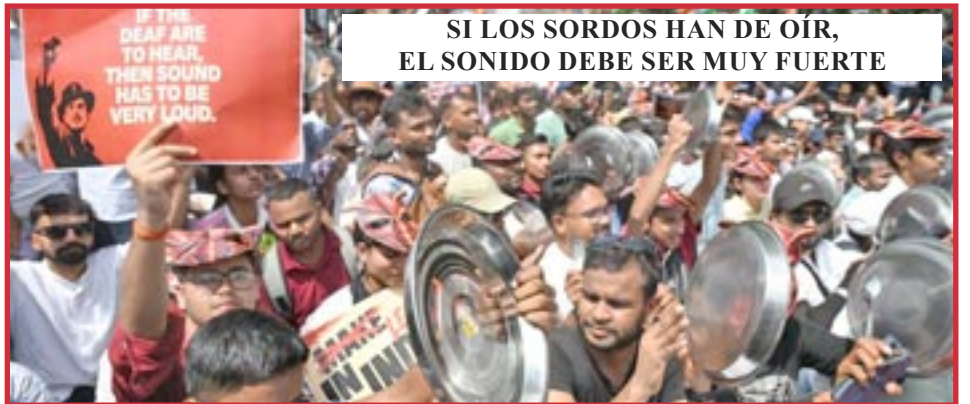
DELHI, 20 de junio de 2026

Por más de dos meses, hemos construido conexiones cercanas con cientos de jóvenes. Entendemos su frustración. La mayoría de los del PCOI también han experimentado el desempleo. Nos unimos al PCOI porque solo el comunismo tenía sentido para nosotros.